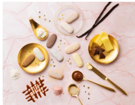
「ハッピーターンズ」